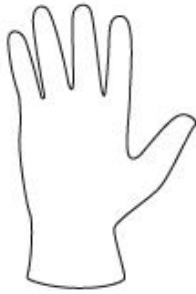
INDOSSARE UN GUANTO MONOUSO