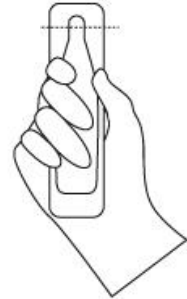
TAGLIARE SEGUENDO IL SEGNO TRATTEGGIATO